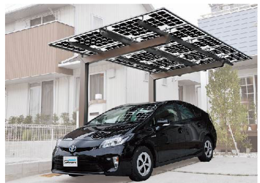
<掲載されている製品の一例、太陽電池搭載カーポート「ソーラーパーク」>