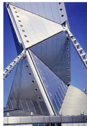
<水戸芸術館の近接写真>