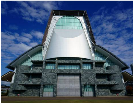
<グランシップ西面 コーン型外装>