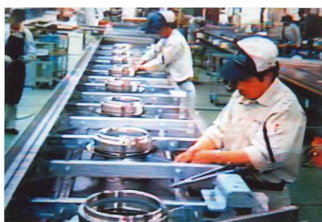
<水戸芸術館のチタン・パネルを製作する様子>