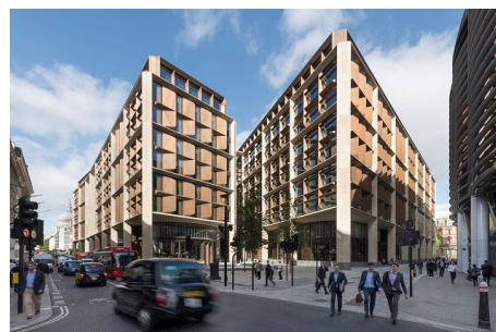
<2017年 ブルームバーク新欧州ビル：イギリス>