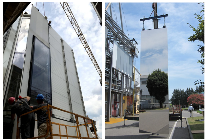
< Boksto 6: リフト外壁のステンレス大型鏡面パネル > 左: 取付の様子 右: 菊川工場にての映り込み検査の様子

バロック様式とゴシック様式の建物を復元し歴史的要素を保存するコンセプトのもと、菊川が納めた鏡面パネルが歴史的景観を映し古い街並みの景色を増大することで、新旧の融合を目指しています。