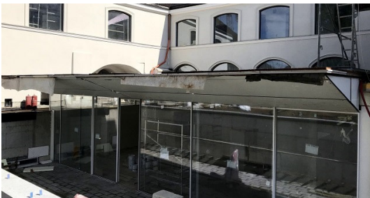
<Boksto 6: レストラン屋根のステンレス鏡面パネル> 上: 屋根パネル施工の様子 下: 施工後の屋根先端部

建築物の金属製内外装工事を手がける菊川工業株式会社（本社：東京都墨田区、代表取締役社長：宇津野嘉彦、以下菊川）は、バルト三国の南に位置するリトアニア共和国の首都ヴィリニウス旧市街のプロジェクト「Boksto 6（呼称：ボクスト シックス）」に、大型鏡面パネル450㎡を昨年の11月と今年の7月の2回に渡り納めたことのお知らせします。