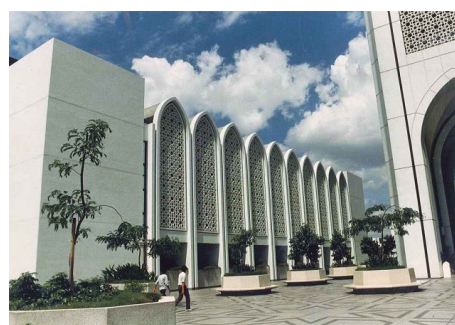
<1984年 ダヤブミビル：シンガポール>

2000年のタイの寺院であるダーマカイパコダや2017年のロンドンのブルームバーク新欧州ビルのような、海外プロジェクトならではの規模が桁違いに大きいプロジェクトも受注するようになり、そのたびに組織を含めた体制構築や新規の設備投資を行うなどして、お客様に満足いただけるようにプロジェクトを完遂。経験を積み、ノウハウをさらに蓄積しています。