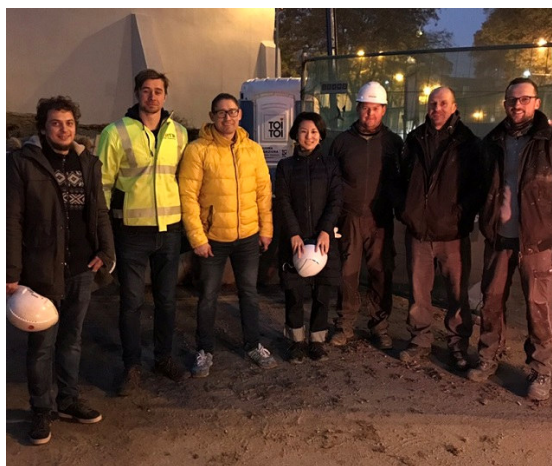
<現地施工会社及び取付職人と当社社員（中央）の記念写真>