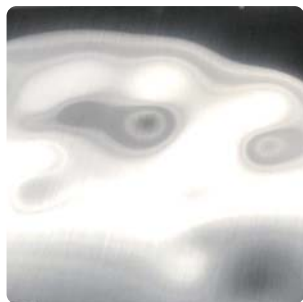
ヘアライン仕上げ