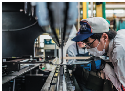
職人技を加味し実現する高品質な曲げ加工