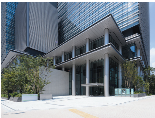
大手町プレイス 東南側エントランス 丸柱パネル(アルミ)