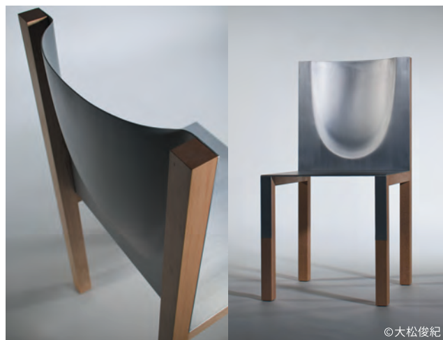
「Shades of Michelangelo」 by 桑沢デザイン研究所×菊川工業 椅子(アルミ)