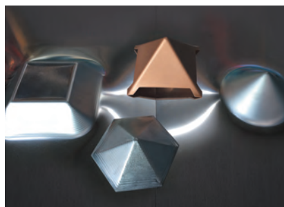
様々な形状のインクリメンタル加工サンプル