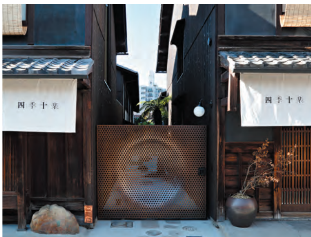
四季十楽 門扉(銅合金)