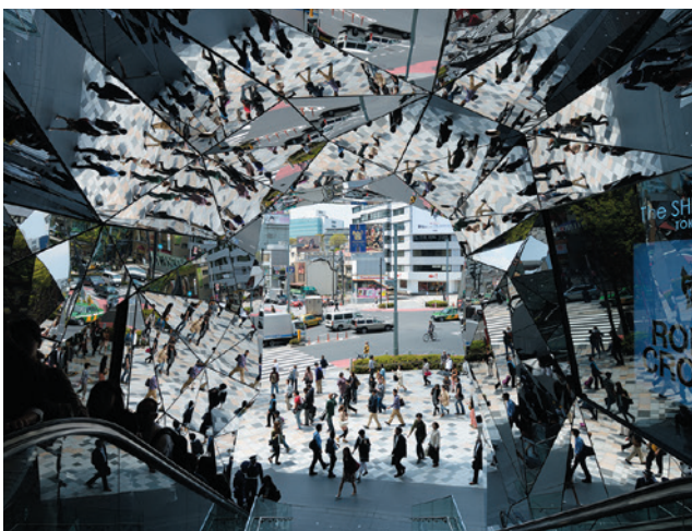
東急プラザ表参道原宿 万華鏡スタイル外装パネル(ステンレス)