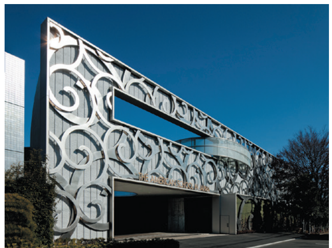
ASIJ(アメリカン・スクール・イン・ジャパン)調布キャンパス 装飾外装(ステンレス)