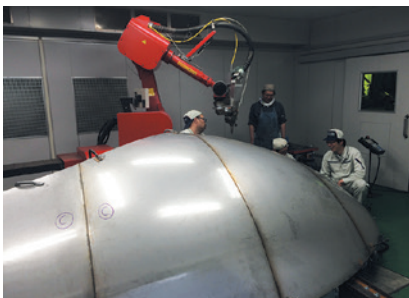
大型3次元製品の溶接にも対応