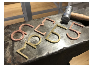
<タッチレス・ブロンズ>

この度のWEBショールームの開設を記念して、「STUDIO K+」は、加工体験コーナーに非接触フック「タッチレス・ブロンズ」を加えました。「靴べら」「ミニ・シンパレ」に続く第3弾となる「タッチレス・ブロンズ」は、ロシア文字をモチーフにした5種類の形状を銅製と真鍮製にて用意しました。ブロンズ（銅合金）製の為、銅による抗菌作用も期待できるアイテムとなります。コロナ禍でもご来場いただけた方にも新たな“楽しみ”を体験いただけるよう、ハンマーなどで模様をつける加工を体験の上、お持ち帰りいただくことができます