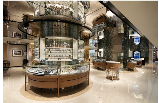
▲天井パネルに水面パネルを採用 伊勢丹新宿店本館 5F ウォッチショップ

菊川は、オーダーにて対応していた水面風エンボスパネルをインテリア工事などでのニーズの高まりを受け、製作方法を規格化し2020年よりKIKUKAWAオリジナル・マテリアルとして販売促進を強化しました。その中で、パターンバリエーションや比較サンプルの問合せが増大したことを受け、3種類の標準パターンを定めました。デザイナーのイメージ補完や比較検討をスムーズにして頂くことで、さらなる需要の取り込みを目指してまいります。