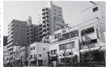
▲幹線道路沿いも個人店舗やマンションが多い

1983年に墨田区菊川町で創業した金属建材メーカーです。千葉県丹津市に工場を建設し本社機能も移転しましたが、菊川の所有地に自社ビルを竣工し、2014年より東京オフィスとしました。昨年10月、東京オフィス敷地内に「サテライト・オフィス」を増築し、オープニング・セレモニーを行いました。ランチングを施したステンレス建材が特徴です。本社・工場の隣に近隣のビルにも親しみを持って頂ければと願っています。