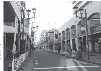
▲商店街には「ゆったり楽しいショッピング」のフレーズ