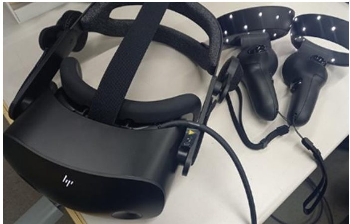
▲使用する VR ゴーグルとコントローラー

描いた図面が実際に施工可能か検証したいという課題を解決するため、施工イメージの確認ができる VR ソフトを導入しました。設計図面から VR 映像を生成するには、3D の図面データ作成が不可欠です。菊川は業界に先駆けて 3D データへの対応体制を整えており、普段から 3D-CAD での設計を多くのプロジェクトで行っていたため、比較的スムーズに VR 技術を導入することができました。