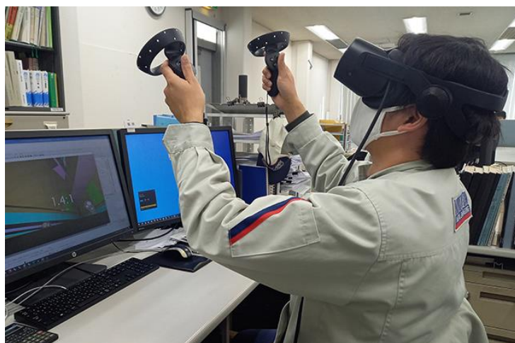
▲VR ゴーグルを装着し映像を操作する様子

3D-CAD で作成した図面のデータを VR ソフトに読み込ませると、立体的な施工イメージが生成されます。専用の VR ゴーグルを装着することで、その立体的な映像を見ることができます。コントローラーを操作して自由に動かしたり拡大したりしながら、あらゆる角度から、作成した図面が立体的にはどう見えるのかを検証していきます。菊川では、昨年より VR ソフトを導入し、4つのプロジェクトで、実際に VR を活用して設計段階での検討を行いました。