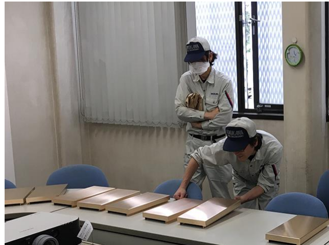
▲ 社内資格試験を行う様子 (左: 試験中 右: 採点中)

今後はさらに社内資格制度を拡充するなど社員の専門性の強化を推進していくことで、社員個人のスキルアップを図るとともに、それを通じて会社全体の競争力強化や生産性向上も目指してまいります。