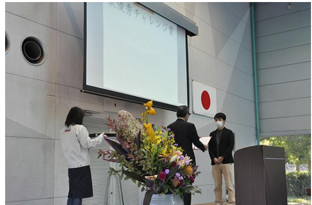
▲ 創業記念式典での表彰の様子

上司と面談した上で、1年間で達成する自己成長目標を社員それぞれが設定し、その達成度を評価に反映させる人事制度です。外部資格や社内資格の取得をこの自己成長目標の一つとして推奨し、社員の資格取得を後押ししています。年に一度開催される創業記念式典では、目標達成率の高かった社員を「優秀チャレンジ賞」として表彰しています。