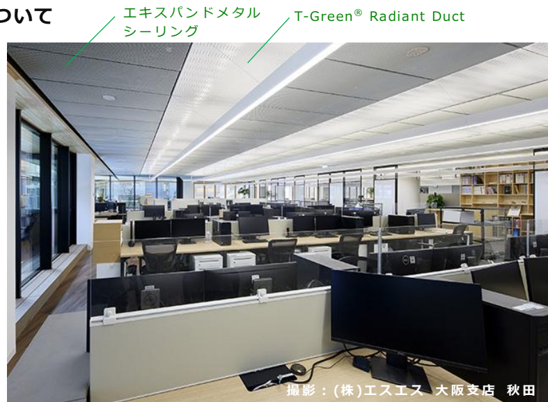
▲大成建設関西支店ビル。「T-Green® Radiant Duct」と「エキスパンドメタル シーリング (CTEXC-D20)」が天井面に交互に配置されている。

「T-Green® Radiant Duct」(*2)は、既存の空調設備を生かしたまま取付可能な放射空調システムです。冷風や温風を直接空間に送るのではなく、ダクト内に空調の空気を流し、ダクトパネルの温度を放射熱の原理で空間に伝えることで室内の温度を調整します。温度ムラが少なく安定するため、省エネにつながります。大成建設は既存建物を ZEB(*3)化する取り組み「グリーン・リニューアル ZEB」を実施しており、その実践例として、自社グループ保有の既存建物の ZEB 化に取り組んでいます。「T-Green® Radiant Duct」が導入された関西支店ビルと横浜支店ビルは、50%以上のエネルギー消費量の削減に適合した「ZEB Ready」認証を取得しています。