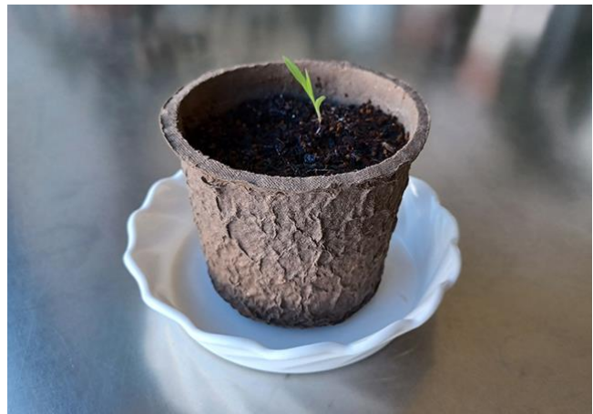
▲古紙を再利用したトイレトーパー(左)と栽培キット(右)