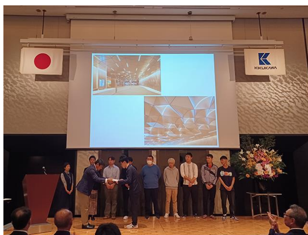
▲記念式典の様子（左：スピーチをする当社社長 右：優秀プロジェクト表彰）