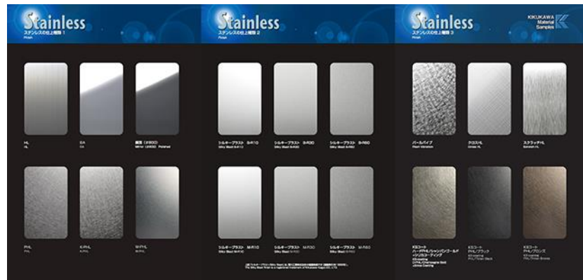
▲サンプル帳 中身イメージ

※ 青字 は今回新たに掲載した仕上げです。各種、対応可能な板厚やサイズが異なります。