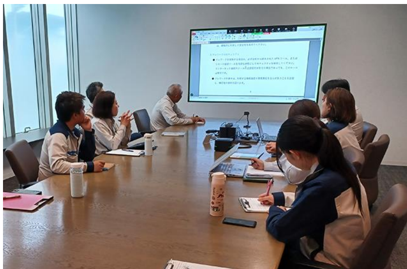
▲2026年6月11, 18, 19日に実施した情報セキュリティ知識強化研修の様子。 5回の開催で、各回合わせて計53名の社員が参加した。

ウイルス対策ソフトの導入といった技術的な側面はもちろんのこと、ガイドラインの策定や推進委員会の設置、研修の実施など、人的・組織的な側面における対策も講じています。情報セキュリティ体制の強化を通じて、マルウェア等による重大インシデントの発生をゼロに抑えています。