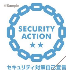
▲「SECURITY ACTION 二つ星」のロゴマーク

2022年4月に「SECURITY ACTION 二つ星 *2 」を宣言し、情報セキュリティ基本方針を策定・公開しました。その基本方針に従い、同年5月には各部門に配置された推進委員からなる「SECURITY ACTION 推進委員会」を設置。月に1度のミーティング開催を通じて最新情報の共有・対策の周知徹底を図っています。